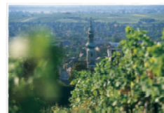
Kur- & Biedermeierstadt Baden - kaiserliche Sommerfrische, wo Ludwig van Beethoven Teile seiner 9. Symphonie komponierte, Möglichkeit zu einem Stadtpaziergang durch Baden (auch geföhrt).

Hotel Krainerhütte • A-2500 Baden bei Wien • Am kleinen Wegerl im Helenental TEL: +43 (0)2252 - 44 511 • FAX: +43 (0)2252 - 44 514 • office@krainerhuetten.at www.gruppenhotel.com