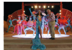
Seefestspiele Mörbisch - Römersteinbruch St. Margarethen: Mekka der Operette und Opern, Aufführungen Juli und August.

€ 180,-- /Person im Doppelzimmer Einzelzimmerzuschlag € 15,--/Nacht