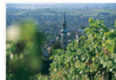
Kur- & Biedermeierstadt Baden - kaiserliche Sommerfrische, wo Ludwig van Beethoven Teile seiner 9. Symphonie komponierte, Möglichkeit zu einem Stadtpaziergang durch Baden (auch geführt).

Hotel Krainerhütte • A-2500 Baden bei Wien • Am kleinen Wegerl im Helenental TEL: +43 (0)2252 - 44 511 • FAX: +43 (0)2252 - 44 514 • office@krainerhuetten.at